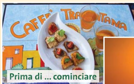
Prima di ... cominciare